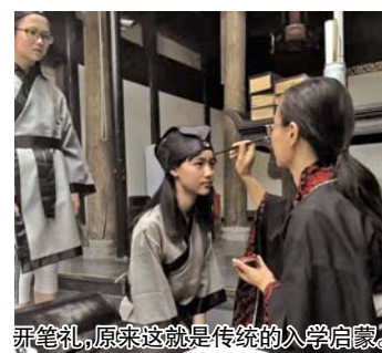
拜笔礼，原来这就是传统的入学启蒙。