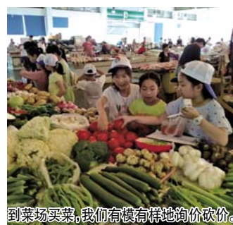
到菜场买菜，我们有模有样地询价议价。