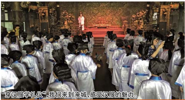
“穿汉服学礼仪”，我们来到淹城，感受汉服的魅力。