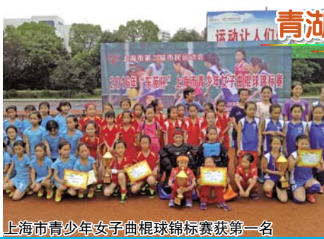
上海市青少年女子曲棍球锦标赛获第一名