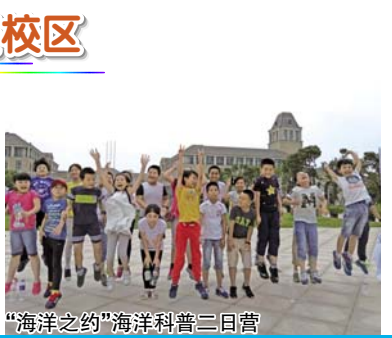
“海洋之约”海洋科普二日营