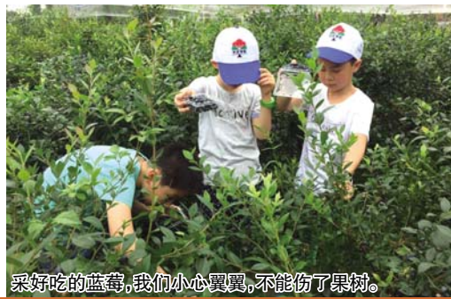
采好吃的蓝莓，我们小心翼翼，不能伤了果树。