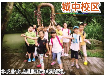
小队合影，摆出最快乐的态度。

送别了骄阳似火的暑假，热情灿烂的九月向我们缤纷而来，又是一个新学期开始啦！回顾假期，同学们都过得充实而有意义！我们采蓝莓、做蛋糕、穿汉服、游览名胜……让我们一起来回味活动中的精彩瞬间吧！