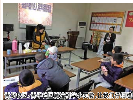
青湖校区：青平社区魔法科学小实验，让我们仔细瞧