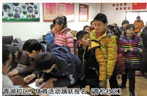
青湖校区：体育活动踊跃报名 (青松社区)