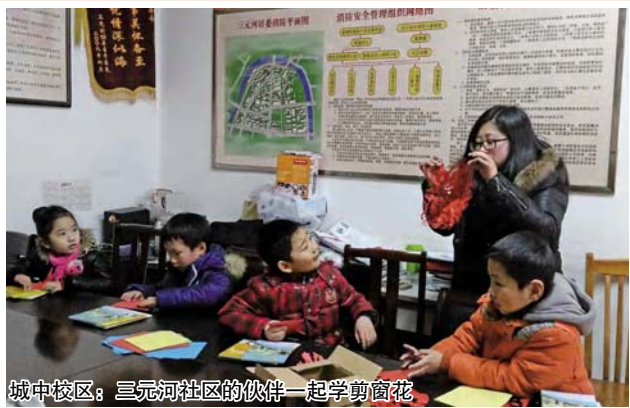
城中校区：三元河社区的伙伴一起学习剪窗花