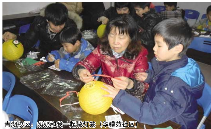
青湖校区：奶奶和我一起做灯笼 (华骥苑社区)