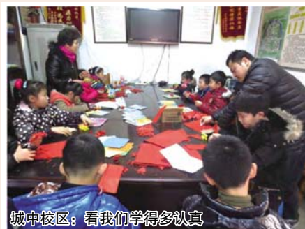
城中校区：看我们学得多么认真