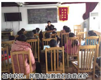
城中校区：民警叔叔教我们自我保护