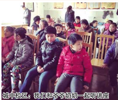
城中校区：我们和爷爷奶奶一起听讲座