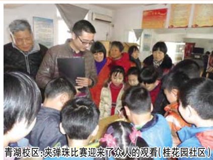
青湖校区：夹弹珠比赛迎来了众人的观看 (桂花园社区)