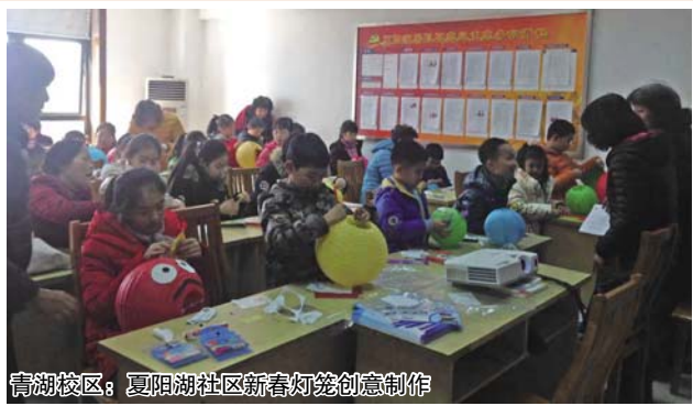
青湖校区：夏阳湖社区新春灯笼创意制作