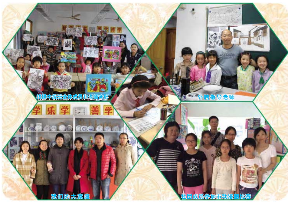
线描中班级全体成员和老师合影

区教研室专家多次亲临学校观摩社团活动、指导社团工作。线描画社团也将一如既往、再接再厉，努力成为学校进一步推进和深化艺术教育的主力军。