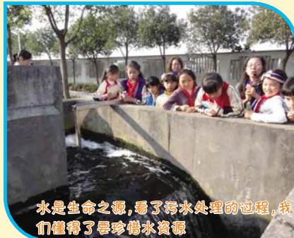
水是生命之源，看了污水处理的过程，我们懂得了要珍惜水资源