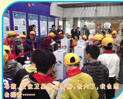
导航、定位卫星那么神秘，长大了，我也想去探索……