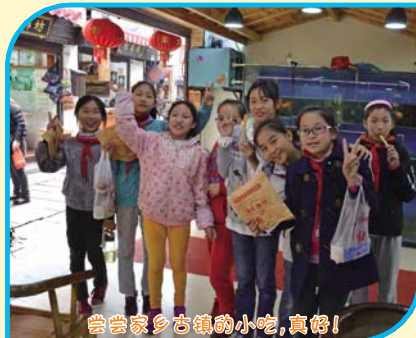
尝尝家乡古镇的小吃，真棒！