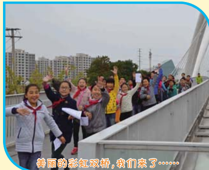
美丽的彩虹双桥，我们来了……