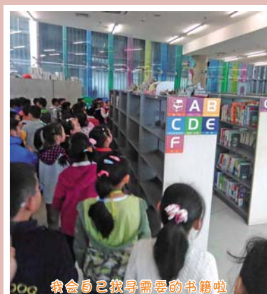
我会自己找寻需要的书籍啦