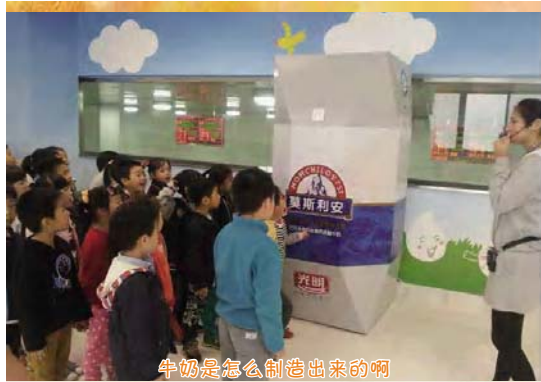
牛奶是怎么制造出来的啊

“碧云天，黄叶地，秋色连波，波上寒烟翠……”、“纷纷坠叶飘香彻……”在这迷人的秋色中，我校一至五年级的孩子们踏着轻快的步伐走上了“小眼看家乡”的社会实践活动。这次实践活动我们安排了光明乳业、夏阳湖、图书馆、警营基地、消防中心、北斗基地、巴安基地、朱家角古镇远足等活动，让我们一起跟随孩子们，分享他们在活动中的点滴快乐吧！