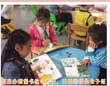
原来办理借书这么方便，只要的学生电子证